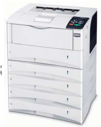
Magasin papier (PF-430)

Choix d'options, en fonction des besoins :